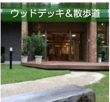
ウッドデッキ&散歩道

ウッドデッキを設置し、気軽に外気に触れることができます。また、そこから続く散歩道は施設を外周しており、心おだやかに過ごしいただけます。