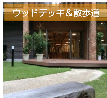
ウッドデッキ&散歩道

お手洗いは、ホール内に3か所設置しており、車椅子の方でも安全にご利用いただける広さと、設備を備えております。