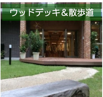
ウッドデッキ&散歩道

お手洗いは、ホール内に3か所設置しており、車椅子の方でも安全にご利用いただける広さと、設備を備えております。